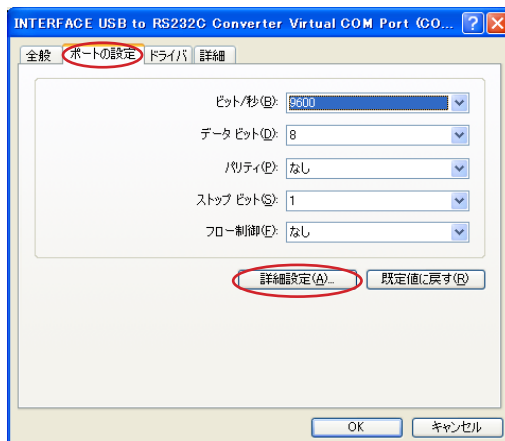
図2 詳細設定ボタンを押す